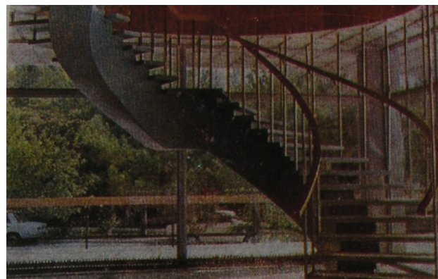
Лестница и фрагмент интерьера первого этажа. [9, с. 1]

Реконструкция истории строительства и бытования здания магазина «Янтарь» затруднена крайней скудостью источниковой базы, в частности – почти полным отсутствием графических материалов.