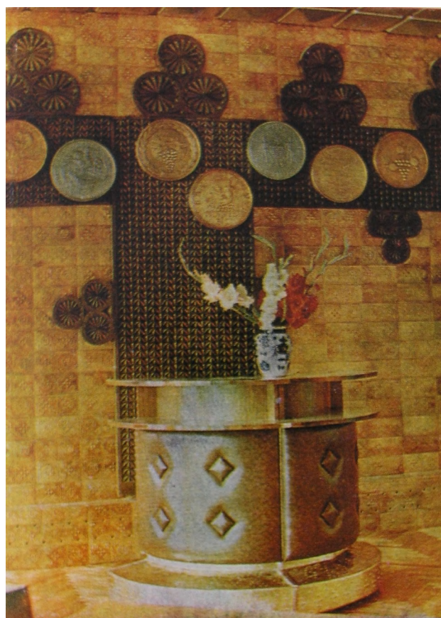
Фрагмент интерьера дегустационного зала [9, с. 5]

Значение курортного места город Геленджик, имевший до 1915 г. статус селения, стал приобретать еще с конца XIX столетия, когда здесь, после прокладки шоссе Новороссийск - Сухуми, началось массовое строительство дач-