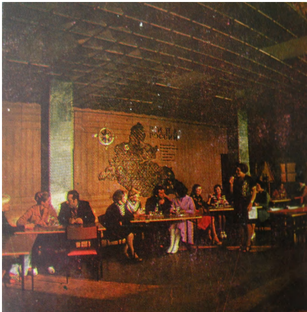
Фрагмент интерьера дегустационного зала. [9, с. 2]

В такой ситуации перечень источников по истории здания-памятника ограничился