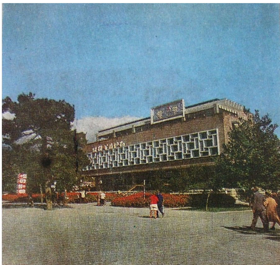
Вид на здание с набережной. Геленджик: фото из кн.: Приглашаем в фирменный магазин «Янтарь»: Рекламно-информационное издание. Ереван, б/д. Обложка.

Функциональное назначение здания также нашло отражение в оформлении фасада: выше линии перекрытия второго этажа размещено, со смещением вправо, выступающее вперед за плоскость фасада железобетонное рельефное цветное панно с винодельческой символикой. Над окном второго этажа помещается сделанная металлическими буквами и имеющая электрическую подсветку надпись «Янтарь».