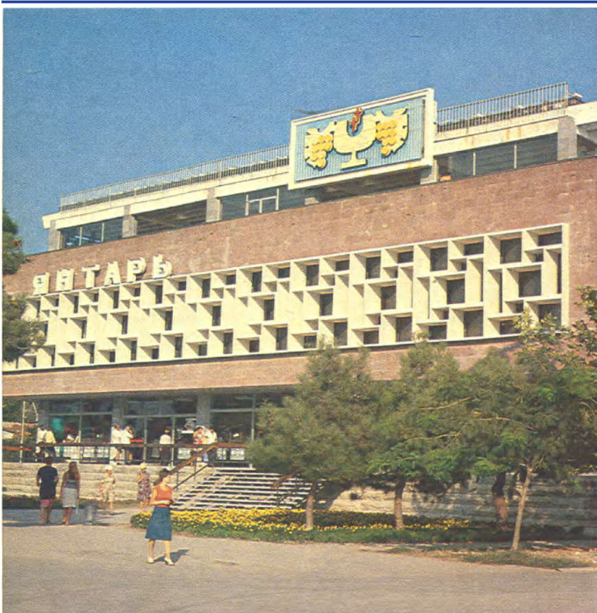
Вид на главный фасад здания.

Информация об объекте, полученная в архивном отделе администрации муниципального образования город-курорт Геленджик, исчерпывается хранящимся в коллекции документов по истории города «Списком памятников истории и культуры», где упомянуто здание магазина «Янтарь» [2, л. 3]. В материалах отдела по делам строительства и архитектуры Краснодарского крайисполкома, хранящихся в фонде Р-1496 Госархива Краснодарского края, в архиве геленджикского филиала государственного унитарного предприятия Краснодарского края «Кравая техническая инвентаризация», каких-либо сведений об объекте также не обнаружено. В процессе архивно-библиографических изысканий было установлено, что проектные материалы по зданию магазина